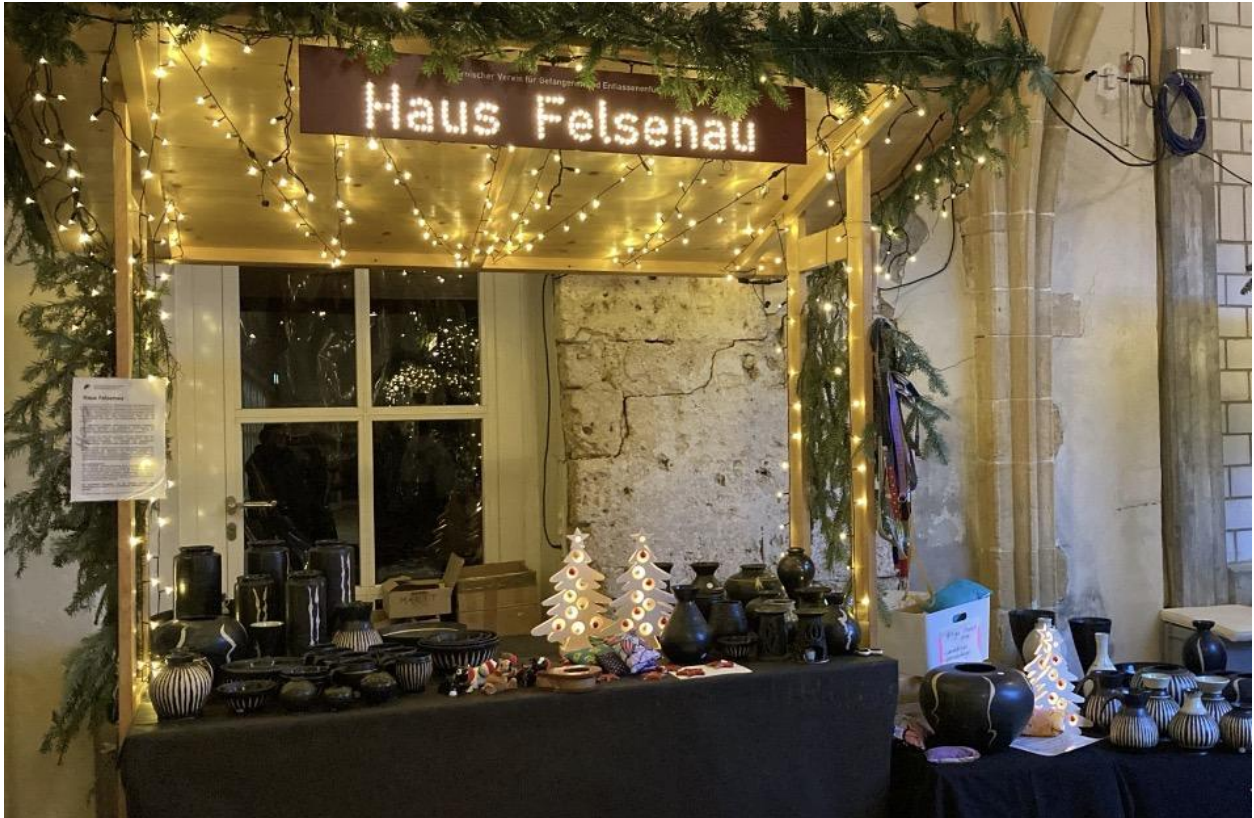
Der Marktstand am «Hannsemärit 2025»

Am 21. und 22. November 2025 hat der Vorstand mit einem Marktstand mit Produkten aus den Arbeits- und Beschäftigungsprogrammen des Haus Felsenau, am Weihnachtsmarkt in St. Johannsen teilgenommen. Die Vorstandsmitglieder verkauften wunderschöne Keramikartikel, zauberhafte, beleuchtete Tannenbäume aus Holz und wohlriechende Lavendelkissen.