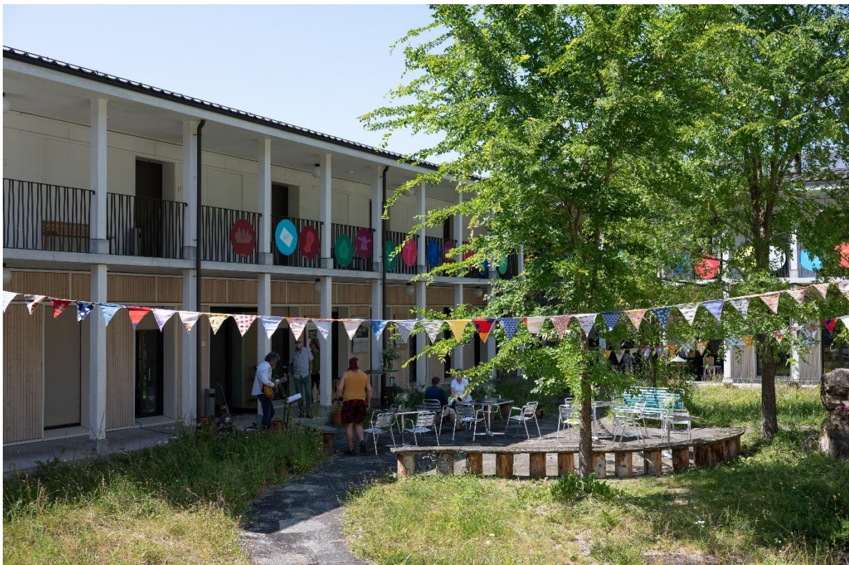
Im Innenhof des Haus Felsenau, kurz vor Beginn des Anlasses «100 Jahre BeVGe»