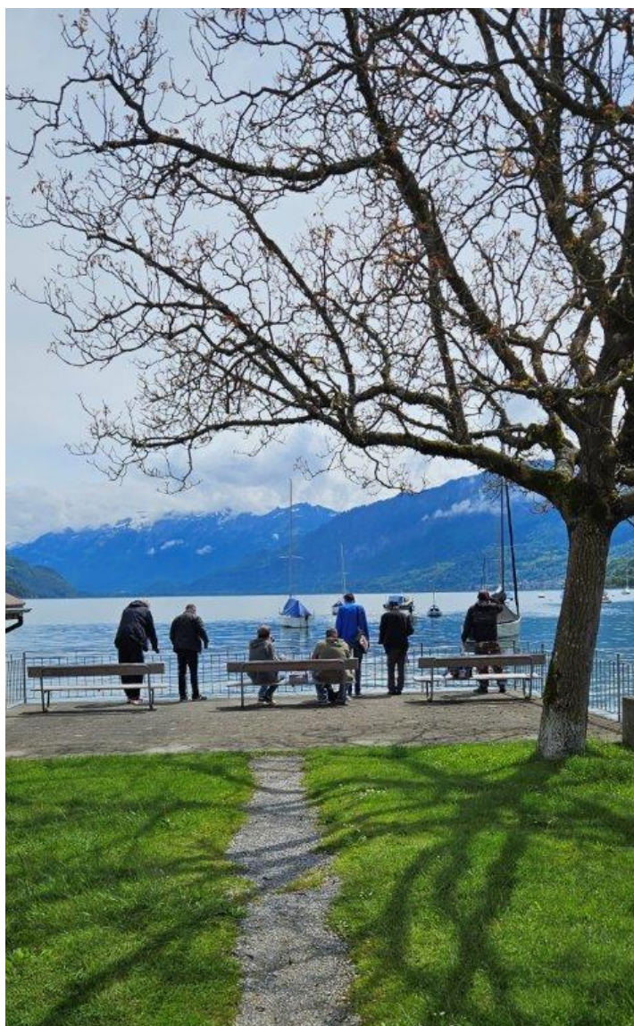
Die Lagerteilnehmenden am Ufer des Thunersees